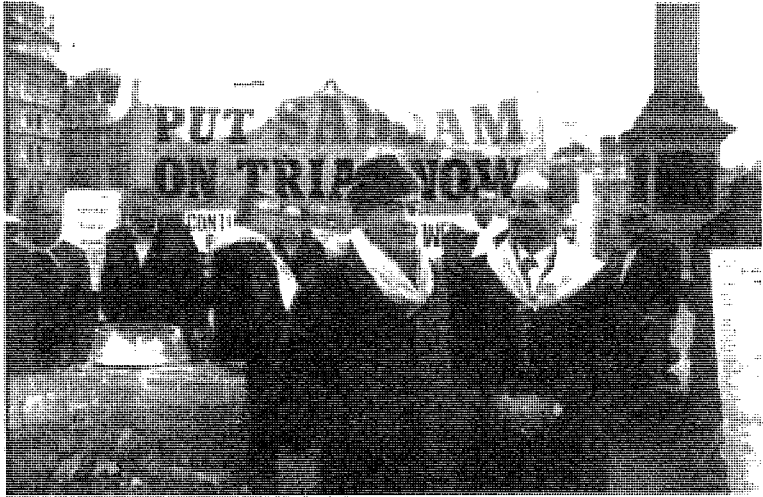
مشاركة أبو سعد في فعالية الاعتصام المستمر ١٩٩٧/١٢/٢٧